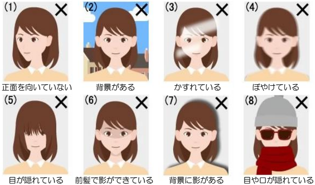
【不適切な写真の例】