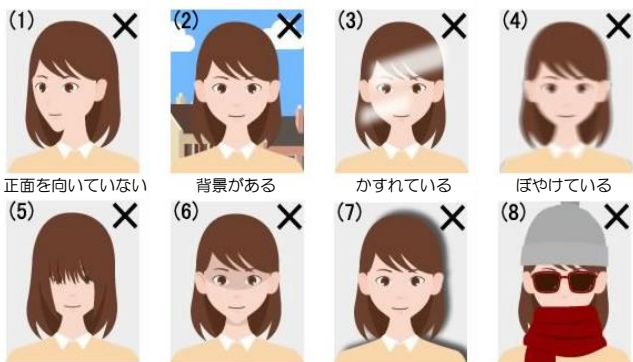
【不適切な写真の例】